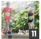
11 MONKEY BALANCE