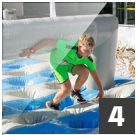
4 IN AND OUT