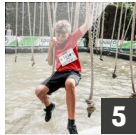
5 POWER ROPES