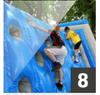
8 CLIMB THE WALL